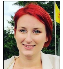
Marine Keresztes Smart Territory Igretec