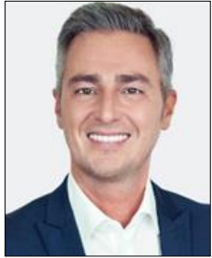
Hugues Bayet Député Bourgmestre Farciennes